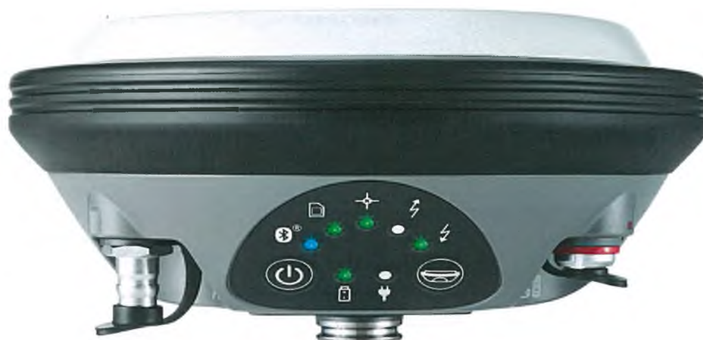
Рисунок 1 - Общий вид аппаратуры геодезической спутниковой Leica GS16 RUS.